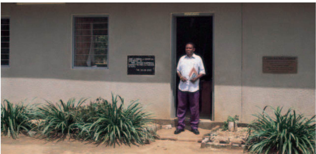
An tUas. Mlemwah, Coordaitheoir an Oideachais Bharda ag an Ionad Acmhainne do Mhúinteoirí i Dumila