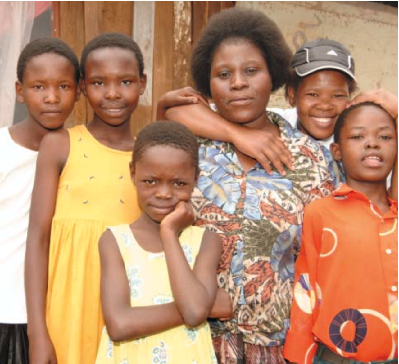
Páistí dílleachta in éineacht le comhairleoir do thacaíocht chlainne ó Ionad Teaghlaigh Khanya (le caoinhead ó N. McHugh)

bochtaineachta i bpobail bhochta tuaithe sna Proibhinsí Eastern Cape, Kwa-Zulu Natal agus Limpopo, trí fháil réidh leis na riaráistí i soláthar na mbunseirbhísí uisce agus sláintíochta. Téann an clár i ngleic leis na riaráistí trí fhorbairt straitéiseach bheartais, trí neartú na n-institiúidí agus trí na seirbhísí uisce agus sláintíochta a sholáthar go díreach chuig pobail bhochta tuaithe arna roghnú.