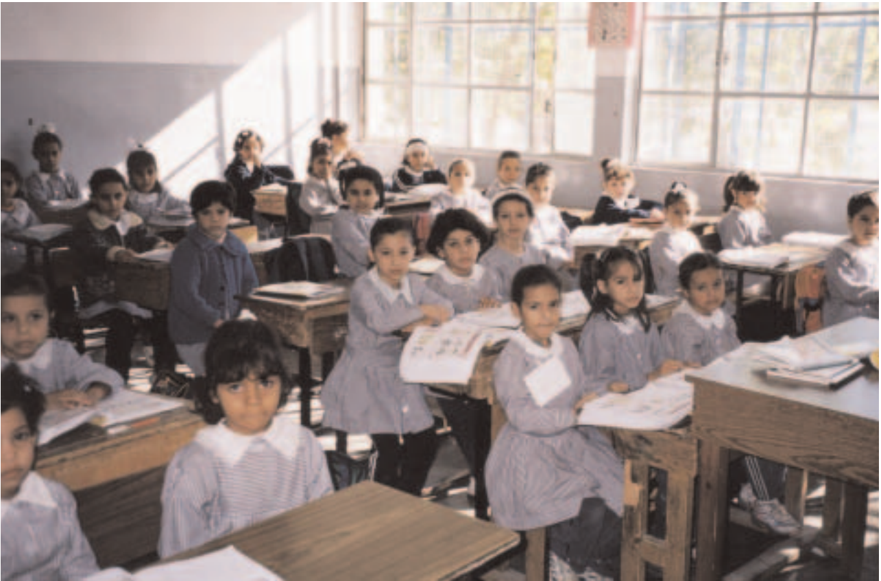
Páistí ocht mbliana d'aois i scoil UNRWA i gcampa dídeanaithe de chuid an UNRWA sa Phalaistín.