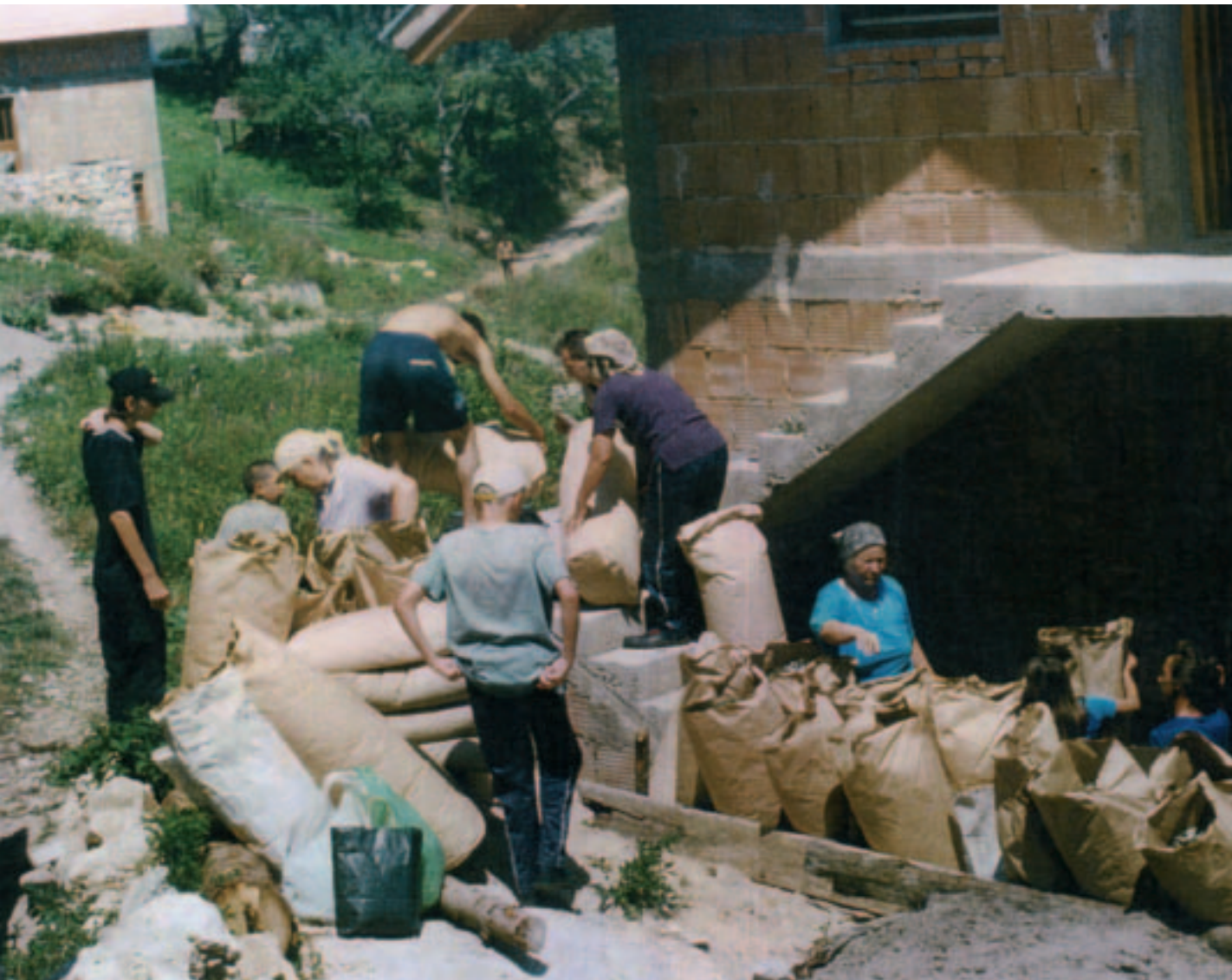
Tionscadal Líonra Comhoibriú Eacnamaíochta– ag saothrú táirgí orgánacha sa Bhoisnia-Heirseagaivéin.